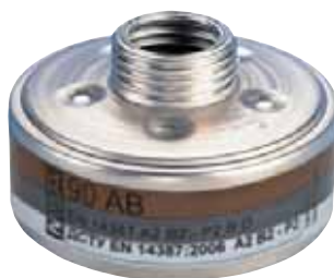
Газовый фильтр 90 AB