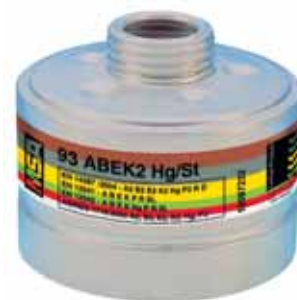
Комбинированный фильтр 93 ABEK 2-Hg/St