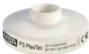
Противопылевой фильтр P3 PlexTec

*Есть стандарт только на маркировку и тип фильтра